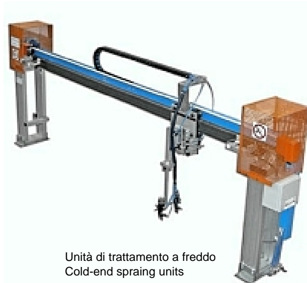
Unità di trattamento a freddo Cold-end spraing units